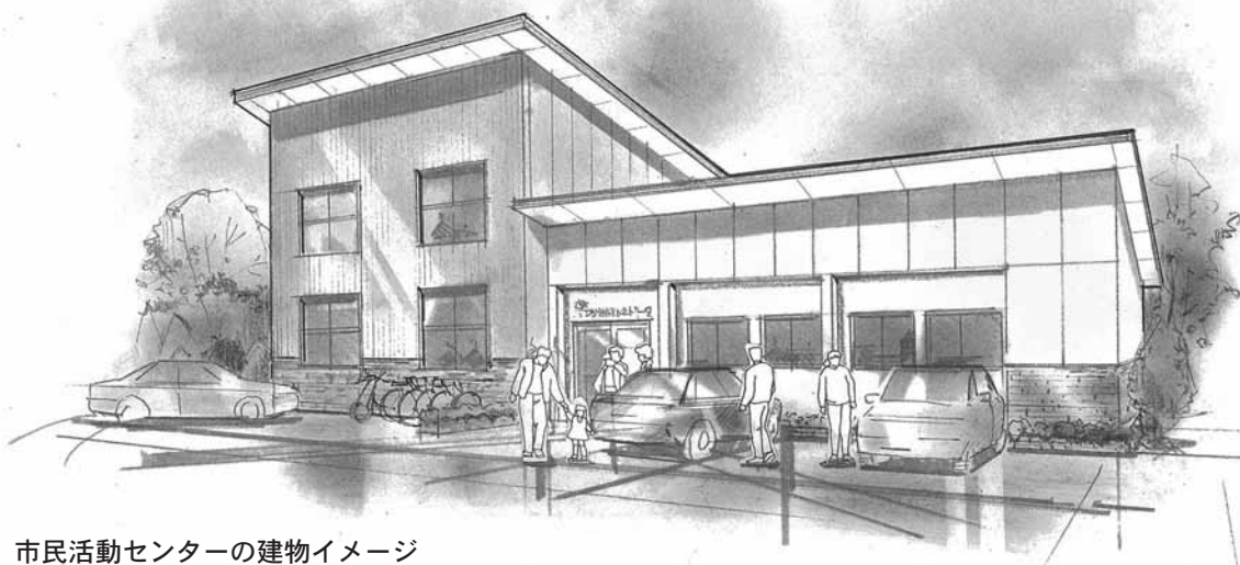
市民活動センターの建物イメージ