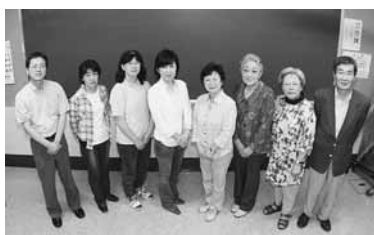
えべつ協働ねっとわーくの皆さん